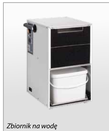
Zbiornik na wodę

Osuszacze serii AD4 zostały wyprodukowane w fabryce w Norderstedt w Niemczech.