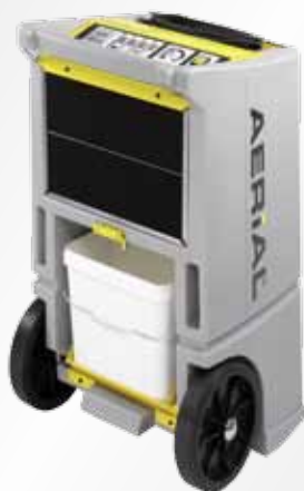
Wbudowany zbiornik na wodę w AD 750