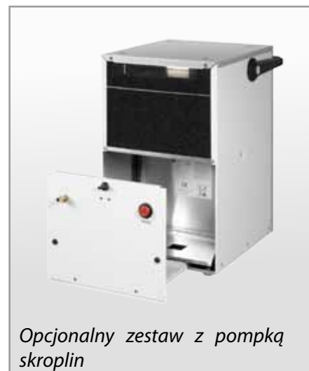
Opcjonalny zestaw z pompką skroplin