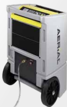
Z opcjonalnie wbudowaną pompką skroplin