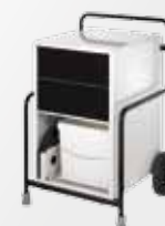
Opcjonalny zestaw z pompką skroplin