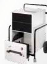
Zbiornik na wodę