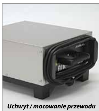
Uchwyt / mocowanie przewodu